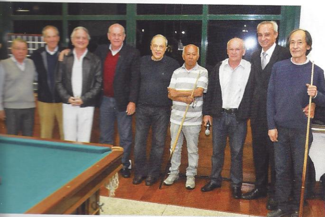
Carne Frita, de listrado, entre amigos jogadores